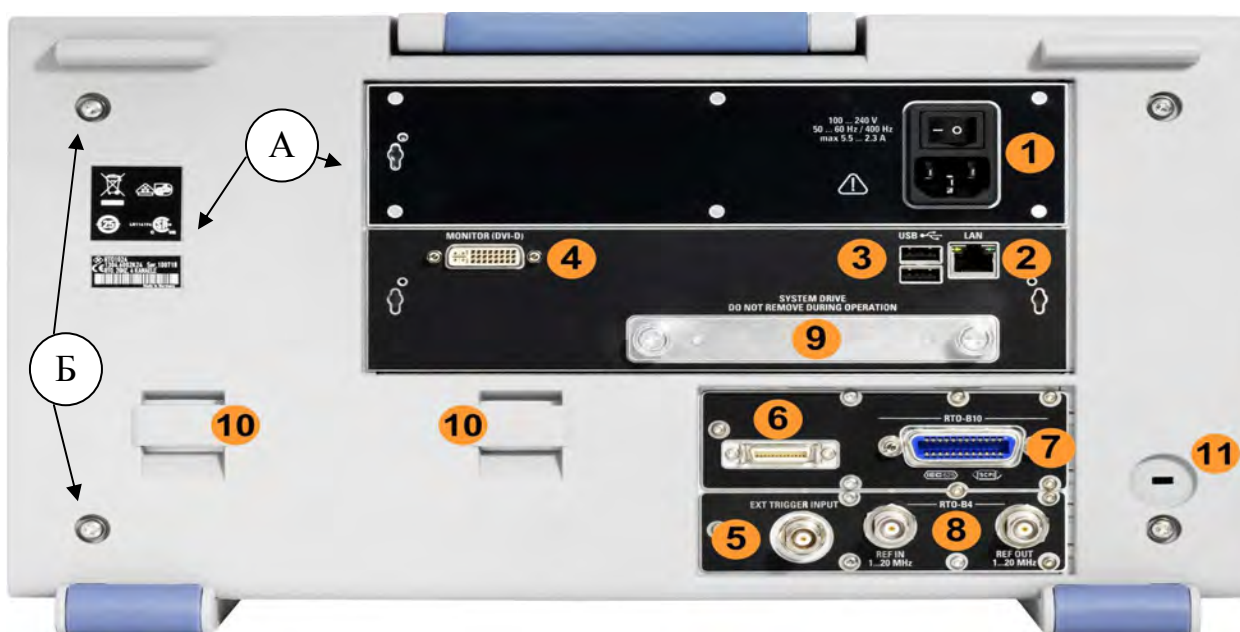
Рисунок 2 - а) Места для размещения наклеек б) Места для пломбировки от несанкционированного доступа