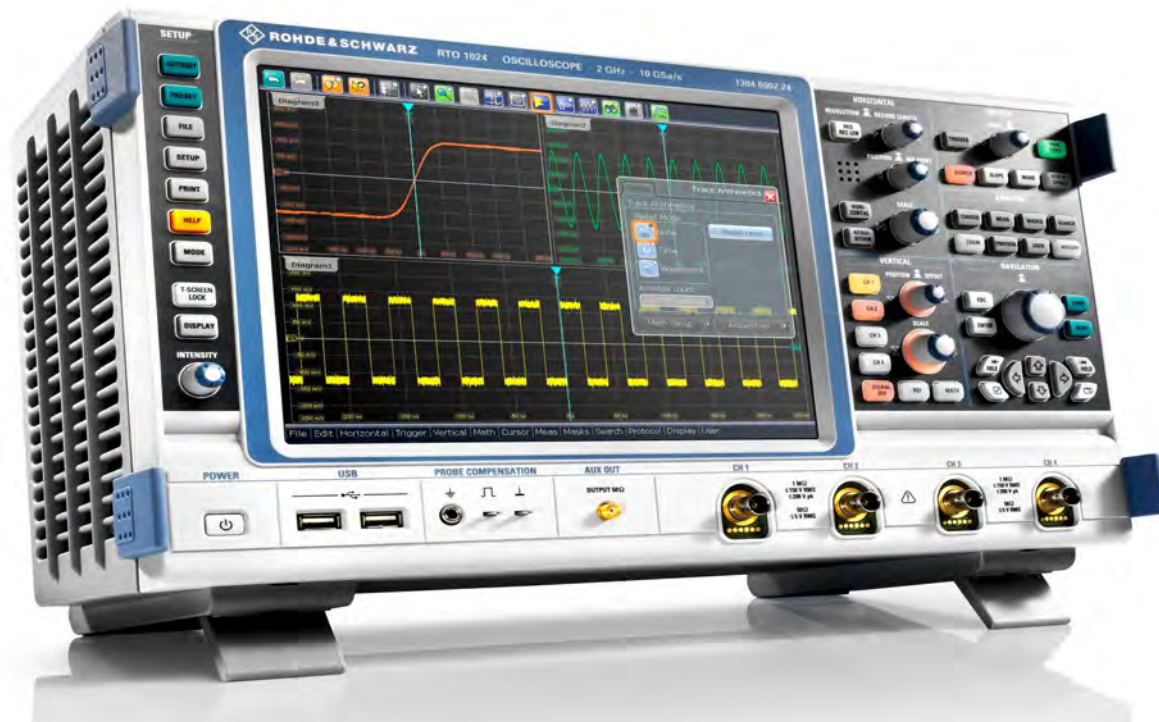
Рисунок 1 - Внешний вид осциллографа

Схема пломбировки от несанкционированного доступа и обозначение мест для размещения наклеек приведены на рисунке 2.